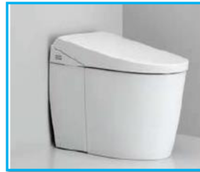
図1 新規に給水管を取り出す場合