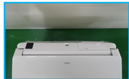
図3 表1のすき間 115mmのイメージ(例)

現在の便器が下の表にないTOTO製の便器から交換する場合は、約10mmのすき間です。