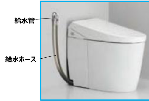
図2 既存の給水管を流用する場合

②床排水仕様の便器で、現在の排水管を利用して便器を交換する場合、便器と後ろ壁との間にすき間が生じます。