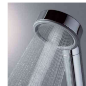
W水流シャワー(メタル)