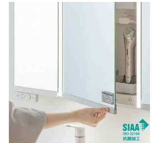
ミラーを開閉する際に触れる部分を より清潔に。上下のミラー扉手掛け 部が抗菌加工。