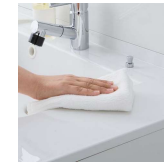
水に濡れた物を置くのに便利な ウェットエリア。継ぎ目や隙間がなく、 汚れてもささっと拭くだけ。