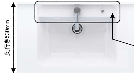
(画像は幅900mm) ●ボール深さ:165mm 容量:12L