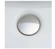
掃除しにくいフチの 隙間がない排水口。