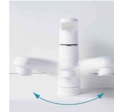
吐水部を左右に首振りできま す。(画像はスコピカタイプ)