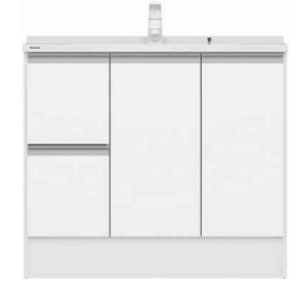
引出しタイプ (画像は幅900サイズ)