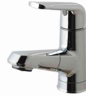
マルチシングルレバー洗面 (メタルタイプ)(エコカチットあり) ※ヘッドは引き出せます。