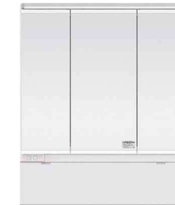
スリムLED3面鏡 ミドルミラー 抗菌加工 750